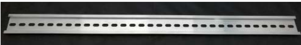
• รางยึดกับบอร์ดที่มีตัวยึด DIN 35 mm. ความยาว 49.7 cm