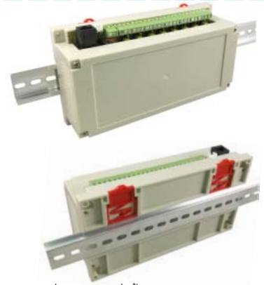
• ตัวกล่องสามารถใส่ได้พอดีกับชุด ET-ESP32-RS485 หรือ ET-I2C IN8/OUT8

• เป็นกล่องพลาสติกสีครีม ขนาด 200 x 110 x 60 mm. เป็นกล่องสำหรับติดตั้งบนราง DIN 35 mm. พร้อม ตัวยึดราง DIN อยู่ด้านหลังกล่อง เหมาะสำหรับงาน PROJECT ต่างๆ ออกแบบ PCB ใส่ภายในกล่อง นำไปติดตั้งบนราง DIN