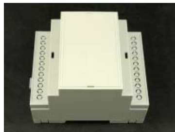
• รูปบอร์ดเมื่อประกอบเสร็จ