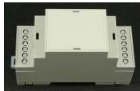
• รูปบอร์ดเมื่อประกอบเสร็จ