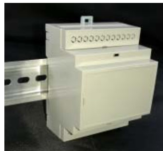
• รูปกล่องเมื่อติดตั้งบนราง DIN 35 mm.