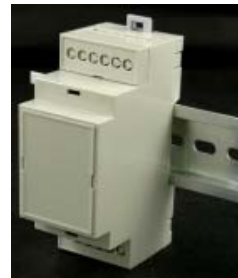
• รูปกล่องเมื่อติดตั้งบนราง DIN 35 mm.